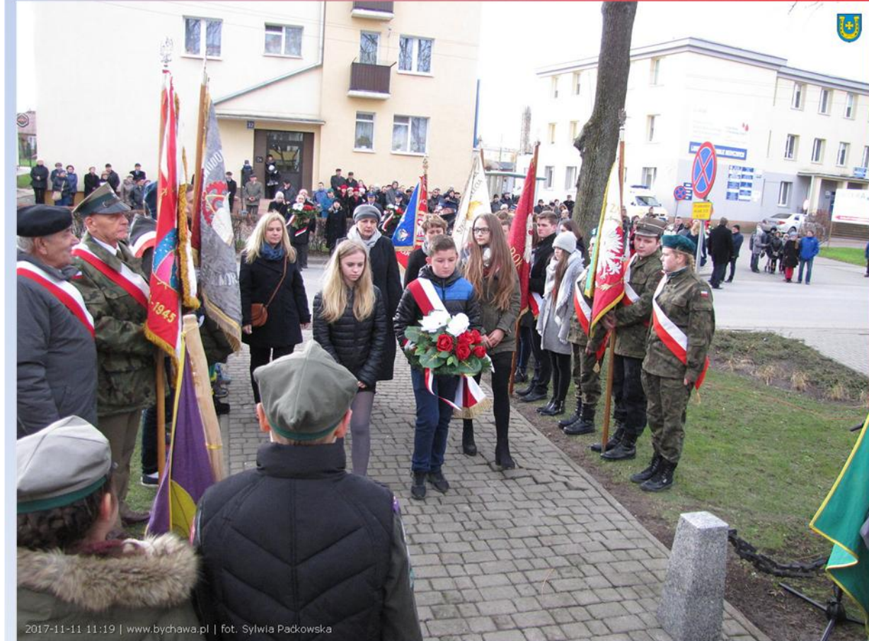
2017-11-11 11:19 | www.bychawa.pl