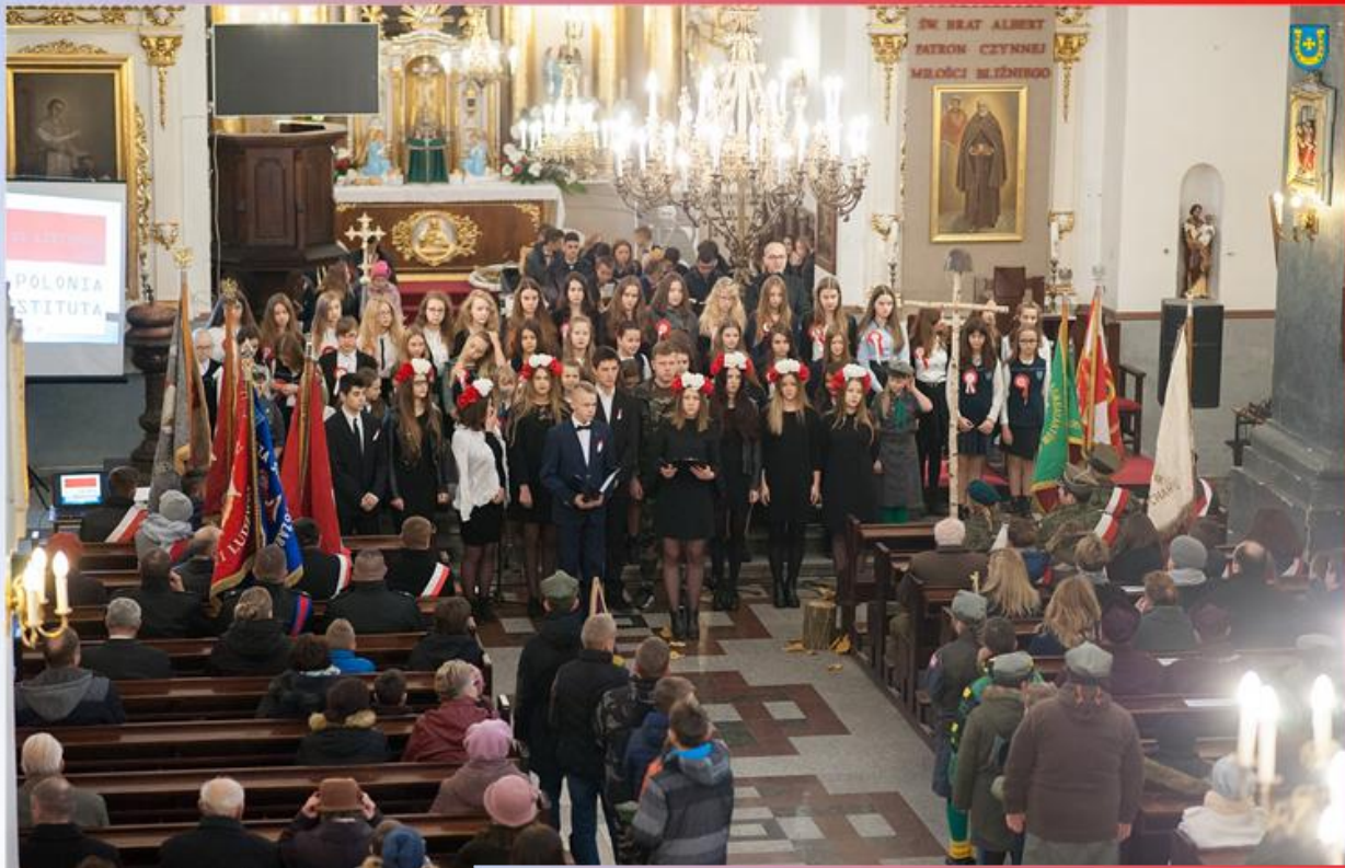
2017-11-11 10:24 | www.bychawa.pl