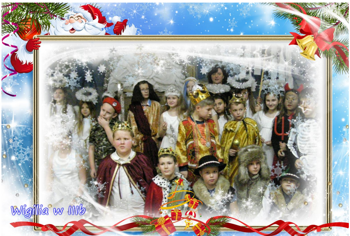
Wigilia w IIIb