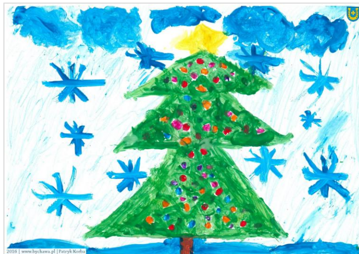
Patryk Korba kl. III d