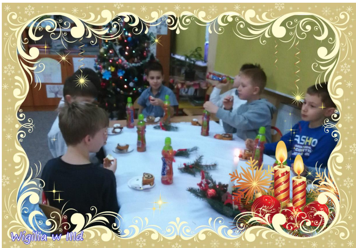
Wigilia w IIIa