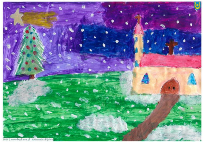
Aleksandra Fijolek kl. III a