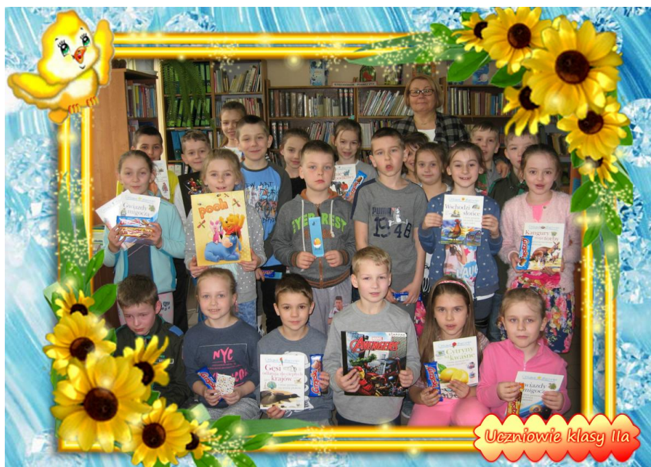
Uczniowie klasy IIa