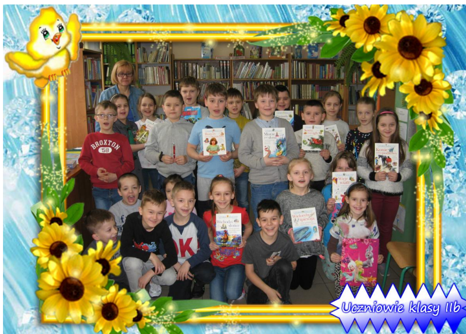
Uczniowie klasy IIb